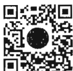
หนังสือนัดประชุม และระเบียบวาระการประชุม สภาผู้แทนราษฎร

การนัดประชุมได้แจ้งให้สมาชิกทราบทางสื่ออิเล็กทรอนิกส์เรียบร้อยแล้ว และท่านสมาชิกสามารถอ่านเอกสารประกอบการประชุมสภาผู้แทนราษฎรได้ โดยการสแกน QR Code หรือทาง www.parliament.go.th